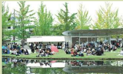
③ かかみがはら暮らし委員会 (岐阜県各務原市のコミュニティ)

2019年に東京の吉祥寺駅近くにオープンした、一つの棚を月3850円で貸している棚貸しの本屋さんです。現在約70名の方が、棚主の契約をしています。最年少の借り手は小学生！カーブ好きの本棚などマニアックな本棚が大変好評だそう。棚を見ると、多くの棚が「自分が今こうである」でなく、「これからこのようになりたい」状態を表現しているように見えてきます。自身がどのようにこのまちで生きていきたいかが表現されていて、棚主同士での交流が生まれたり、棚を疑似家族に見立てたりと、様々な楽しみ方で賑わいを見せています。