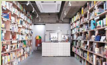
② ブックマンション (東京都吉祥寺の本屋さん)

この芸術祭のキュレーションを行いました。その活動の一つがスナックのマスターとしてスナック3店舗を開業することで。芸術が好きでない人たちともしっかりと交流できればという地域の人の想いから、お互いが出会うきっかけとなる場をつくらうと考えました。始めてみると、スナックは大入り満員となりました。多くの人たちが面と向かった交流ではなく、一人と一人が斜めに出会う「斜めの接点」を持つことでおもしろいことを生み出します。50代、60代の地域の方々と若い人たちの出会いをどう設計するかということ、メディアの手法をうまく使って取り組むことができました。